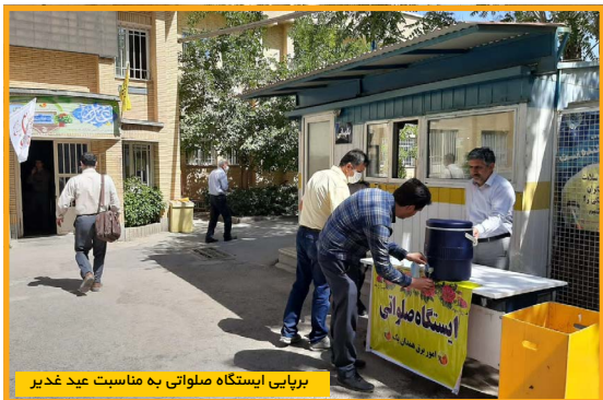
برپایی ایستگاه صلواتی به مناسبت عید غدیر