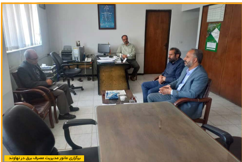
برگزاری مانور مدیریت مصرف برق در نهاوند