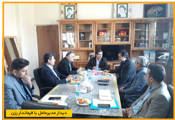
دیدار مدیرعامل با فرماندار زن