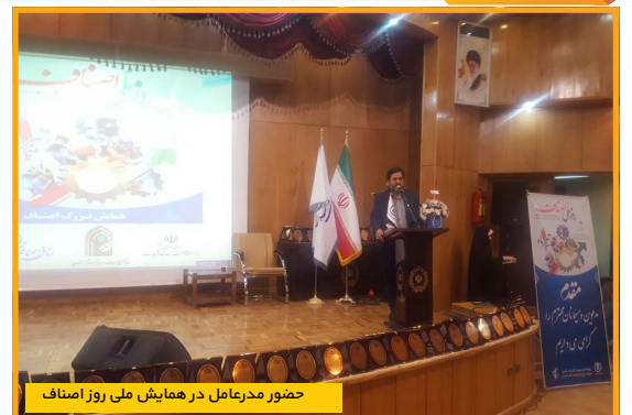
حضور مدیرعامل در همایش ملی روز اصناف