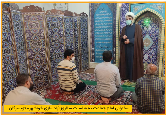
سخنرانی امام جماعت به مناسبت سالروز آزادسازی خرمشهر- تویسرکان