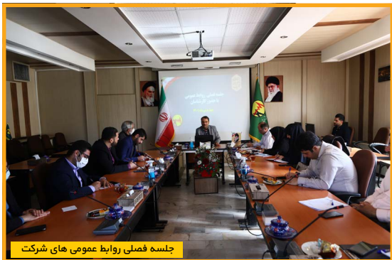
جلسه فصلی روابط عمومی های شرکت