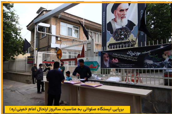
برپایی ایستگاه صلواتی به مناسبت سالروز ارتحال امام خمینی (ره)