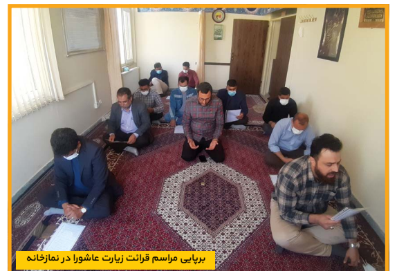
برپایی مراسم قرآنت زیارت عاشورا در نمازخانه