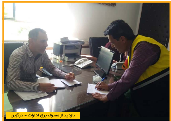
بازدید از مصرف برق ادارات - درگزین