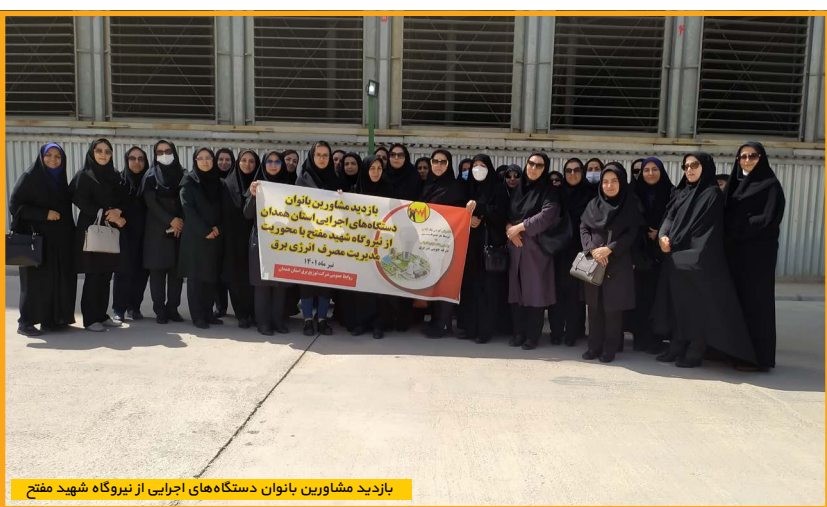
بازدید مشاورین بانوان دستگاه‌های اجرایی از نیروگاه شهید مفتاح