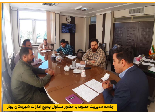
جلسه مدیریت مصرف با حضور مسئول بسیج ادارات شهرستان بهار