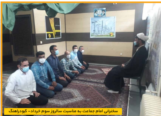
سخنرانی امام جماعت به مناسبت سالروز سوم خرداد- کبودراهنگ