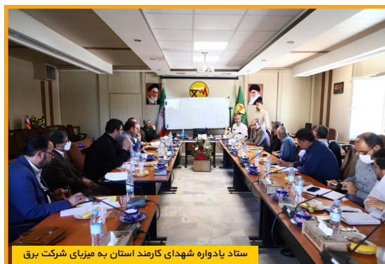
ستاد یادواره شهدای کارمند استان به میزبانی شرکت برق