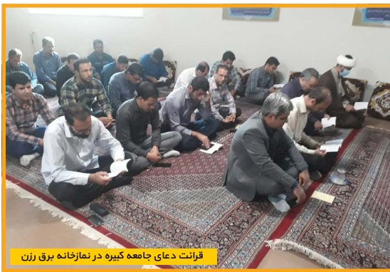
قرائت دعای جامعه کبیره در نمازخانه برق زن