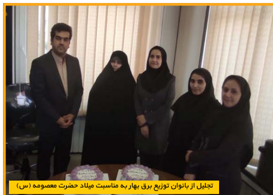
تجلیل از بانوان توزیع برق بهار به مناسبت میلاد حضرت معصومه (س)