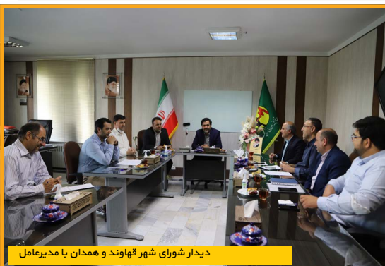
دیدار شورای شهر قهاوند و همدان با مدیرعامل