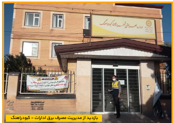
بازدید از مدیریت مصرف برق ادارات - کبودراهنگ