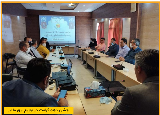
چشم دهه کرامت در توزیع برق ملایر