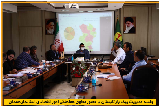
جلسه مدیریت پیک بار تابستان با حضور معاون هماهنگی امور اقتصادی استاندار همدان