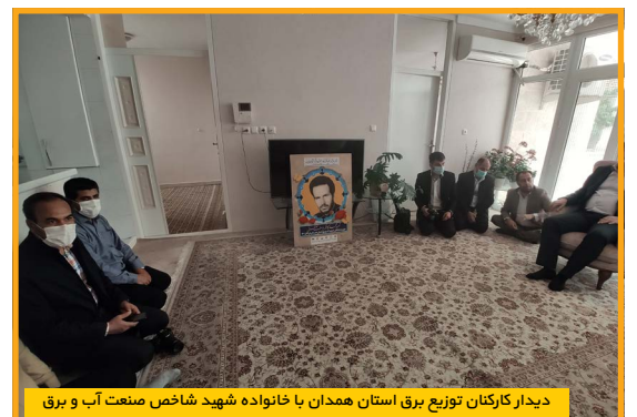
دیدار کارکنان توزیع برق استان همدان با خانواده شهید شاخص صنعت آب و برق