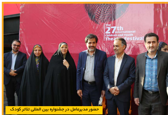
حضور مدیرعامل در جشنواره بین‌المللی تئاتر کودک