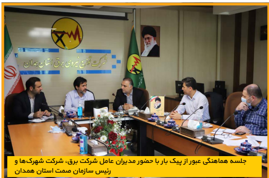
جلسه هماهنگی عبور از پیک بار با حضور مدیران عامل شرکت برق، شرکت شوهرک‌ها و رئیس سازمان صمت استان همدان