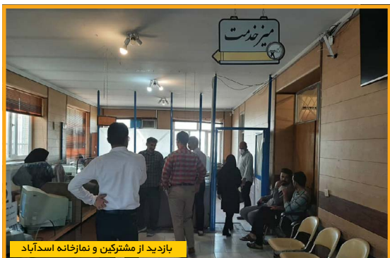
بازدید از مشترکین و نمازخانه اسدآباد