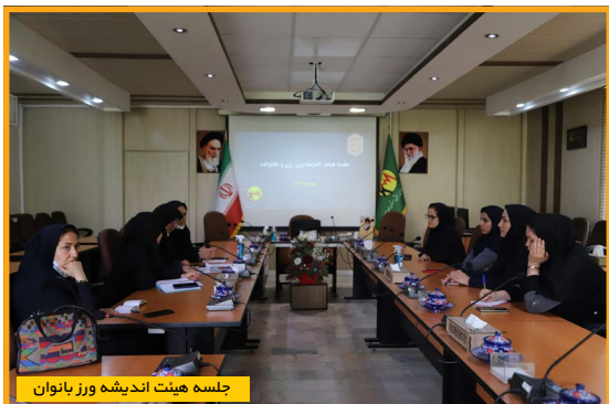
جلسه هیئت اندیشه ورز بانوان