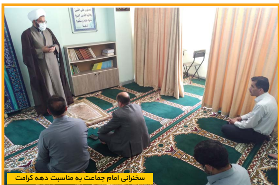
سخنرانی امام جماعت به مناسبت دهه کرامت