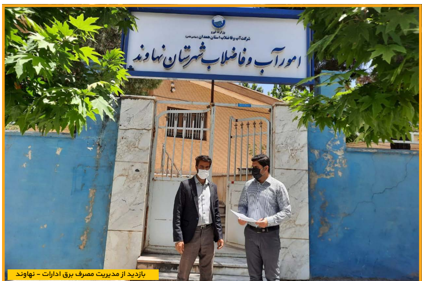
بازدید از مدیریت مصرف برق ادارات - نهاوند