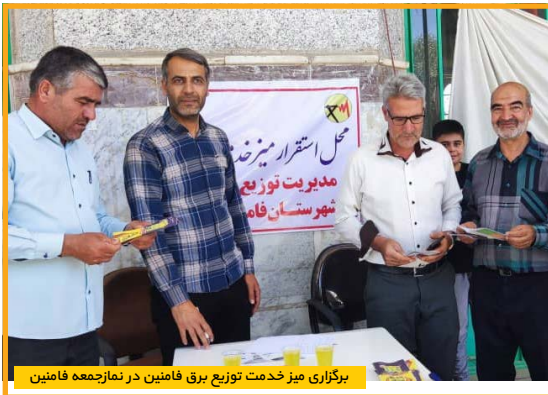
برگزاری میز خدمت توزیع برق فامنین در نمازخانه فامنین