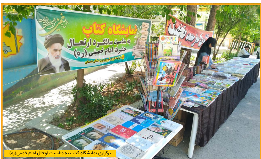
برگزاری نمایشگاه کتاب به مناسبت ارتحال امام خمینی (ره)