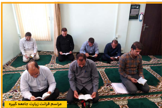
مراسم قرآنت زیارت جامعه کبیره