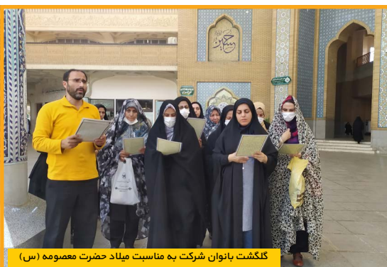
گلگشت بانوان شرکت به مناسبت میلاد حضرت معصومه (س)