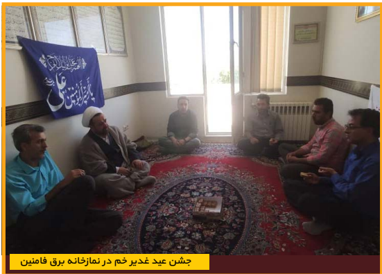
چشم عید غدیر خم در نمازخانه برق فامنین