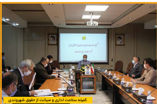
کمیته سلامت اداری و میبانت از حقوق شهروندی