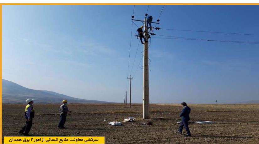
سرکشی معاونت منابع انسانی از امور ۲ برق همدان