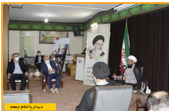
دیدار با امام جمعه