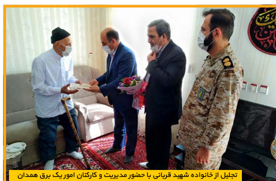
تجلیل از خانواده شهید قربانی با حضور مدیریت و کارکنان امور یک برق همدان