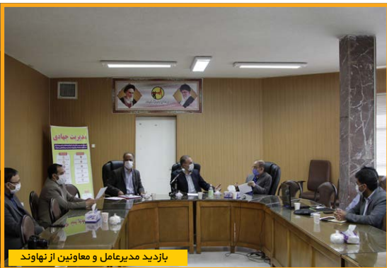
بازدید مدیرعامل و معاونین از نهاوند