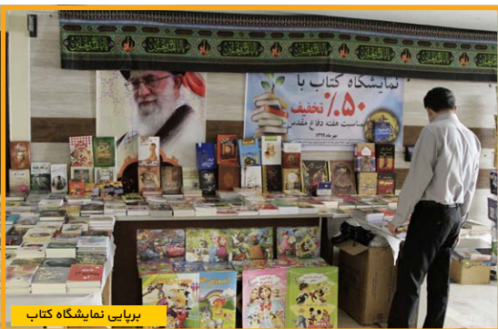
برپایی نمایشگاه کتاب