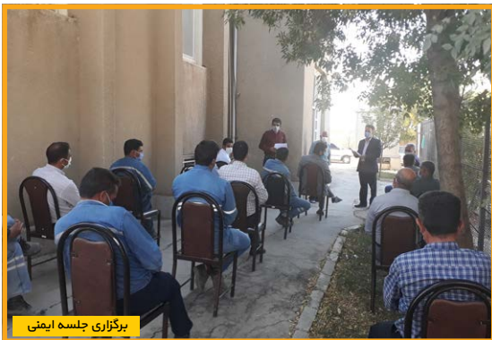
برگزاری جلسه ایمنی