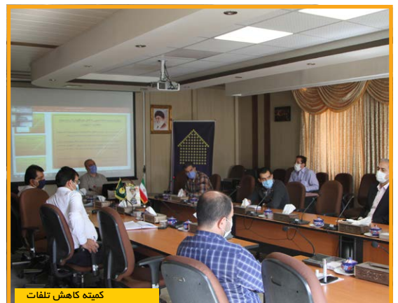
کمیته کاهش تلفات