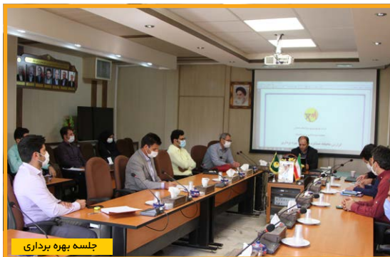
جلسه بهره برداری