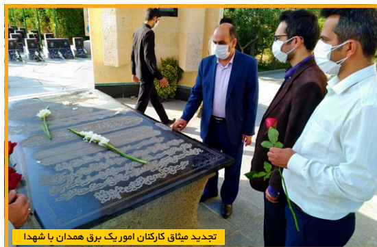
تجدید میثاق کارکنان امور یک برق همدان با شهدا