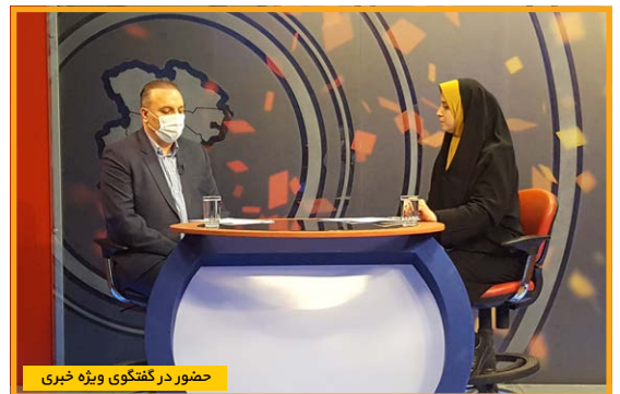
حضور در گفتگوی ویژه خبری