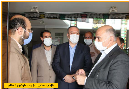
بازدید مدیرعامل و معاونین از ملایر