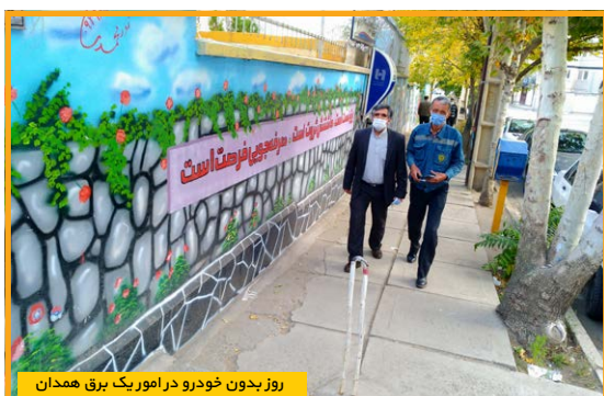
روز بدون خودرو در امور یک برق همدان