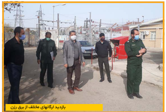
بازدید ارگان های مختلف از برق رزن