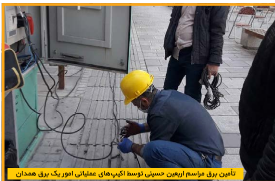
تأمین برق مراسم اربعین حسینی توسط اکیپ‌های عملیاتی امور یک برق همدان