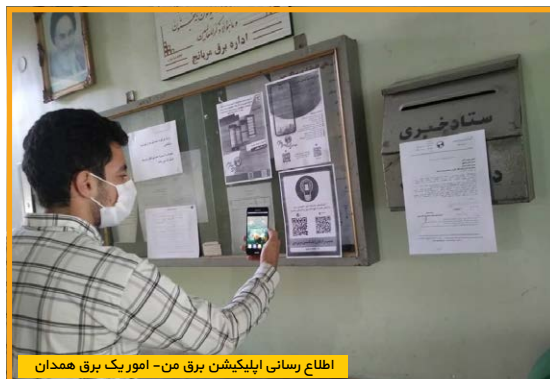
اطلاع‌رسانی اپلیکیشن برق من- امور یک برق همدان