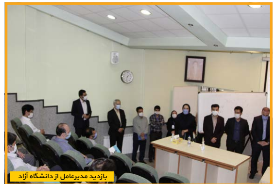
بازدید مدیرعامل از دانشگاه آزاد