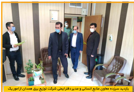
بازدید سرزده معاون منابع انسانی و مدیر دفتر ایمنی شرکت توزیع برق همدان از امور یک