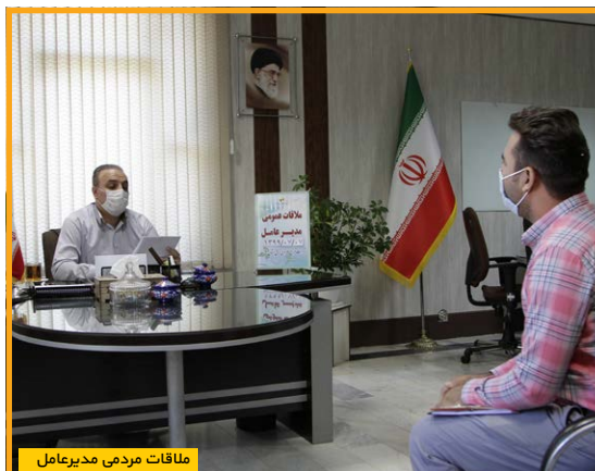
ملاقات مردمی مدیرعامل