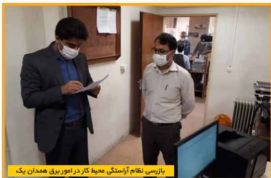
بازرسی نظام آراستگی محیط کار در امور برق همدان یک