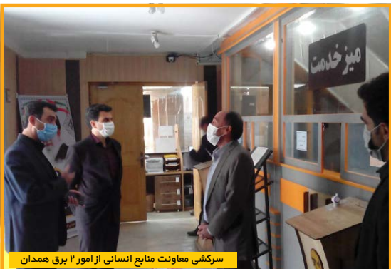
سرکشی معاونت منابع انسانی از امور ۲ برق همدان