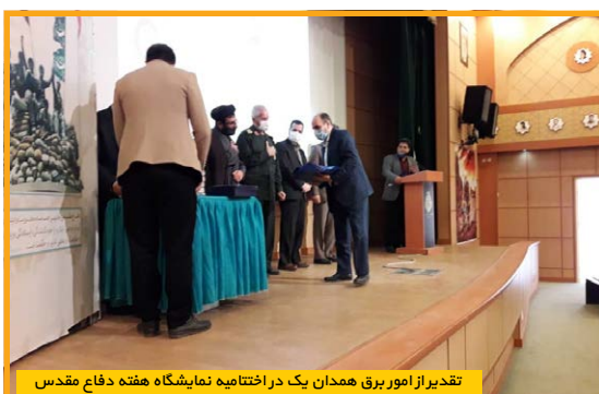
تقدیر از امور برق همدان یک در اختتامیه نمایشگاه هفته دفاع مقدس