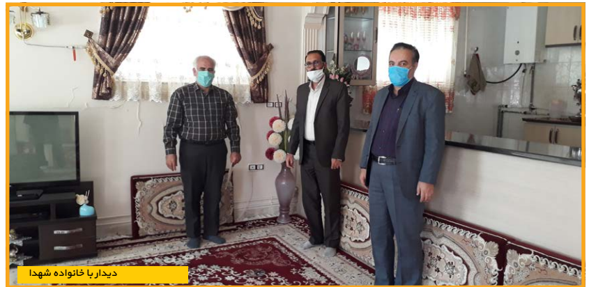
دیدار با خانواده شهدا