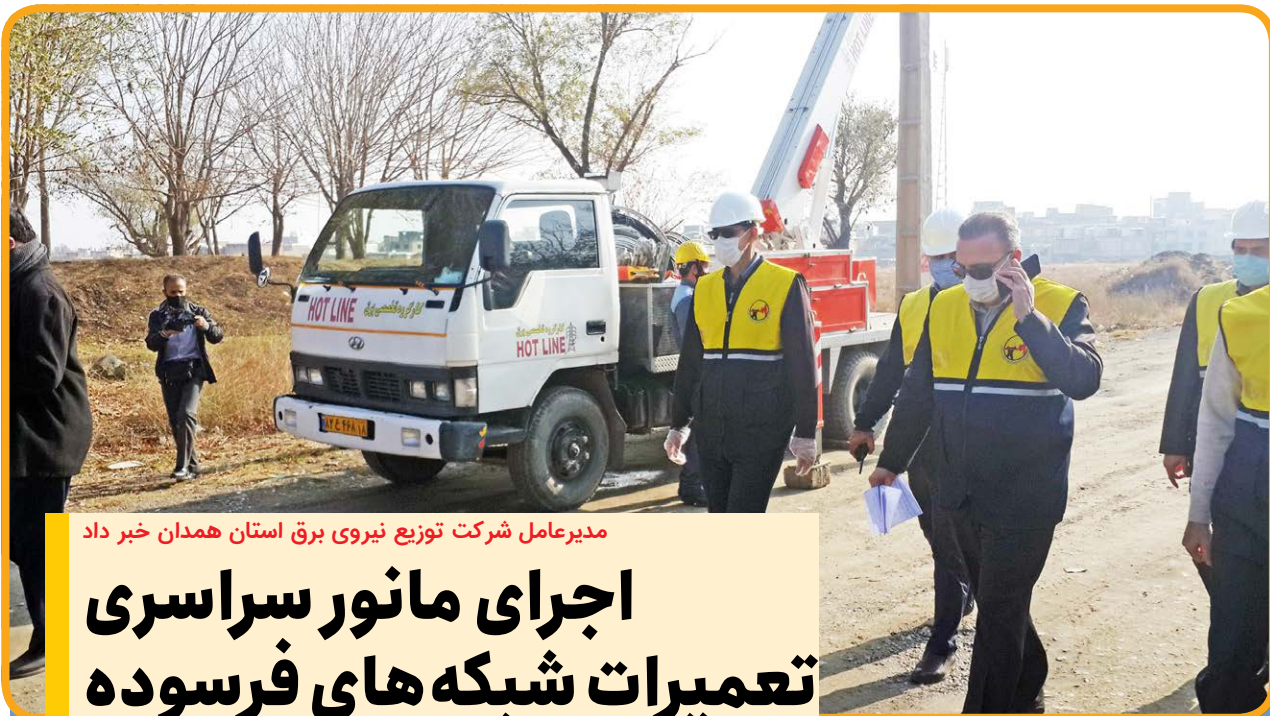
مدیرعامل شرکت توزیع نیروی برق استان همدان خبر داد