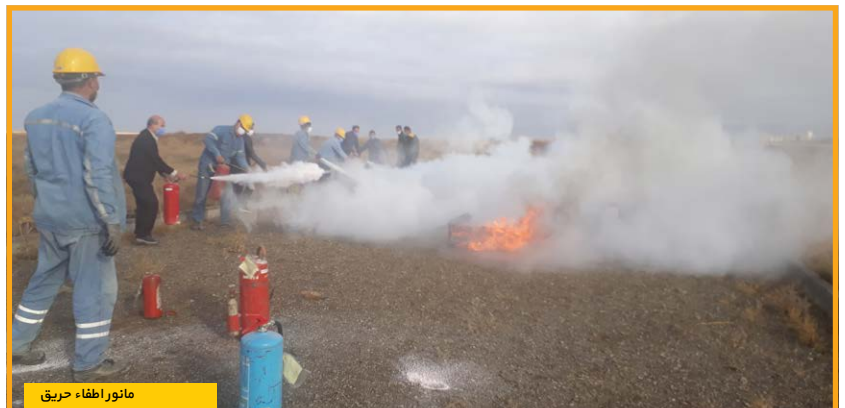
مانور اطفاء حریق