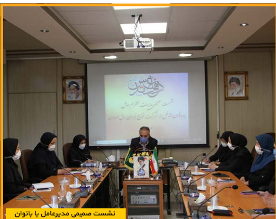
نشست صمیمی مدیرعامل با بانوان