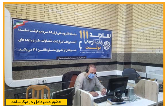
حضور مدیرعامل در مرکز سامد