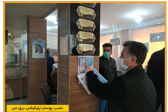
نصب پوستر اپلیکیشن برق من