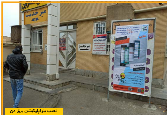
نصب پنل اپلیکیشن برق من