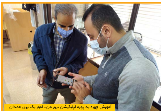
آموزش چهره به بهره اپلیکیشن برق من- امور یک برق همدان