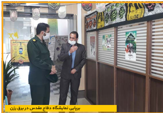
برپایی نمایشگاه دفاع مقدس در برق رزن